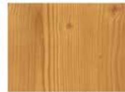
PINO NUDO FILM