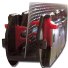
CADENA INFERIOR VERSIÓ FLEXA

MOSQUITERA LATERAL AMB CADENES (ORUGA) TELA LLISA* RECOLLIDA AUTOMÀTICA MITJANÇANT MOLLES